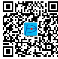
铸造设备与工艺 微 信 公 众 号