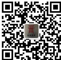
山西省铸造行业协会 微 信 公 众 号