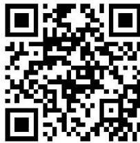
山西省铸造行业协会 网 站 二 维 码