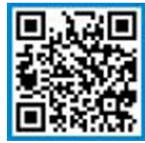
铸造设备与工艺 网 站 二 维 码